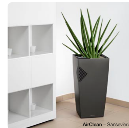
AirClean – Sansevieria