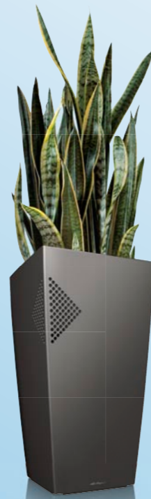
De AirClean is in het bijzonder te gebruiken met een hydroplant met een kluit doorsnede van 20 cm (tot de potmaat 28/19).